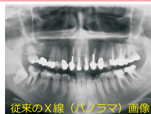
従来のX線(パノラマ)画像