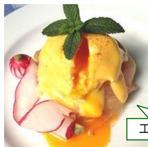
エッグベネディクト

モーニング、ランチ、ディナーとセットメニューが異なり、14:30~16:30のハッピータイムに来店すると10%OFFになる嬉しい時間帯もあります！